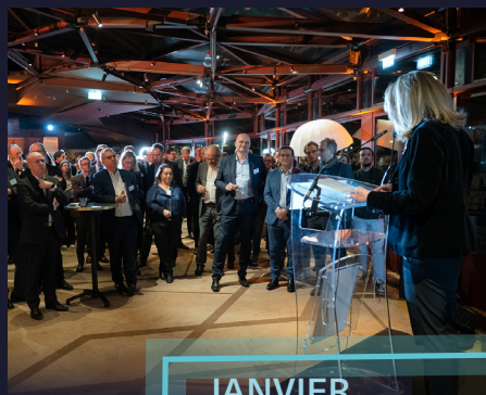
JANVIER Soirée des vœux