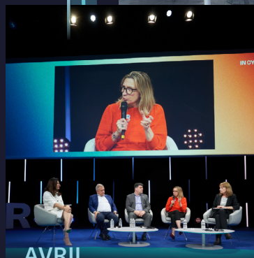
AVRIL Forum INCYBER Les rencontres numérique de Strasbourg