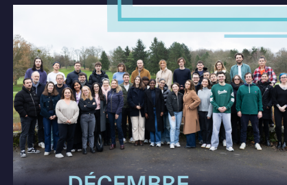
DÉCEMBRE Séminaire d'équipe