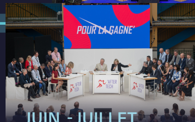
JUIN - JUILLET Lancement de l'Equipe de France du Numérique Rencontres d'Aix