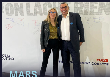
MARS Global Industrie