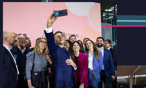
FÉVRIER AI Action Summit