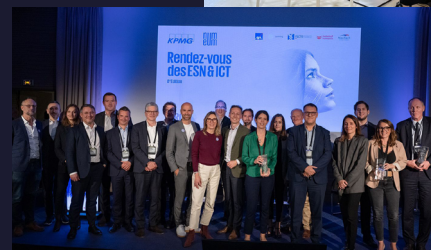
SEPTEMBRE - OCTOBRE BIG Bpifrance RDV ESN ICT