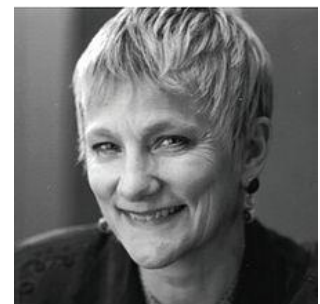
Anita Borg (1949 – 2003) a imaginé un système permettant d'analyser des systèmes mémoriels à haute vitesse