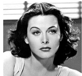
Hedy Lamarr (1914 – 2000) est considérée comme l'inventeuse du GPS